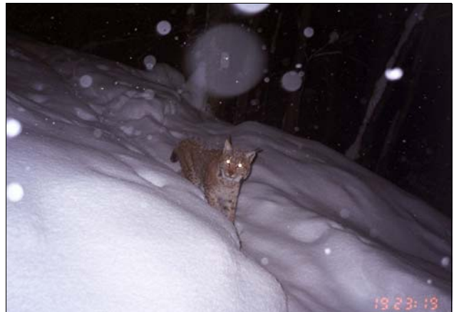
Abb. 3. NURA, Ramisbach, 19.02.2005.

An 8 Standorten wurden insgesamt 15 mal Luchse fotografiert (Abb. 2 & 3). Drei weitere Luchsbilder entstanden an gefundenen Rissen. Alle Luchse konnten wir individuell bestimmen. Fotografiert wurde neben