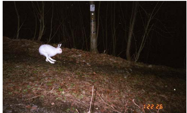
Abb. 5. Schneehase, Torggelbaum, 01.04.2005.

Aufgrund der Ergebnisse der verschiedenen angewendeten Monitoring-Methoden (Fotofallen, Spurentansekten und Zufallsbeobachtungen) gehen wir davon aus, dass sich ein Fotofallen-Monitoring auch in der Nordostschweiz anwenden lässt. Das weitgehende Übereinstimmen der verschiedenen Methoden deutet aber darauf hin, dass bis drei der umgesiedelten Tiere (AURA, BAYA & ODIN) plus zwei bis drei subadulte Luchse fehlen könnten, was den Aufbau einer Luchs-Population in der Nordostschweiz zumindest in Frage stellen dürfte (Abb. 4). Das Nicht-Erfassen gleich