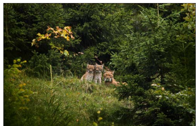
Abb. 6. NURA mit zwei Jungen im Gebiet Mattstock, 29.09.05.

Ein ausführlicher Bericht zum Monitoring-Einsatz 2004/2005 ist in Vorbereitung (KORA-Bericht Nr. 31).