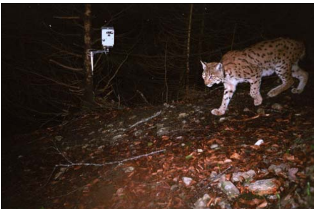
Abb. 2. NEMA, Haldenwald, 17.04.2005. Links im Bild die „Slave“-Fotofalle.

Da die beiden Flanken eines Luchses ungleich gefleckt sind, stellten wir zusätzlich sogenannte „Slaves“ auf, die auf den Blitz des gegenüberliegenden Apparats auslösen (Abb. 2). So konnten Luchse gleichzeitig von zwei Seiten fotografiert werden. Bei den Kontrollen der Fotofallen protokollierten wir allfällige Luchsspuren. An vier Tagen führten wir zusätzliche Spurentansekten im Untersuchungsgebiet durch.